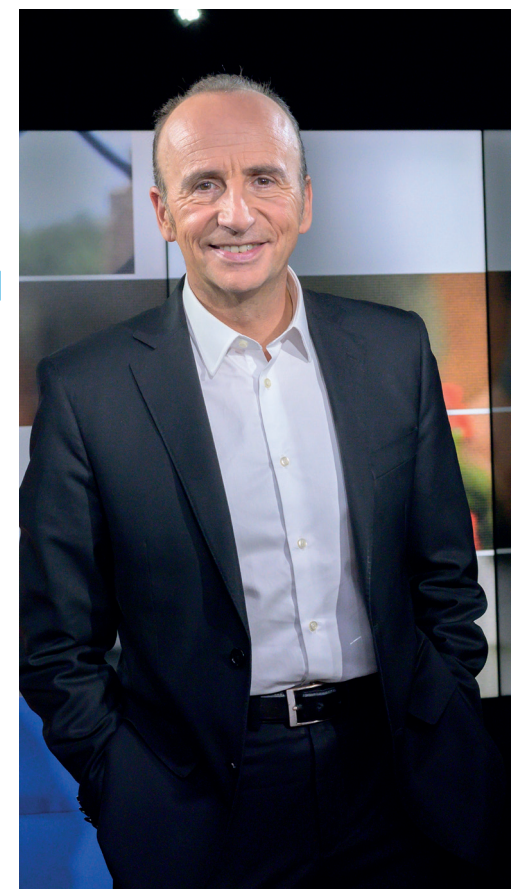
JEAN-PIERRE GRATIEN journaliste, présentateur de DÉBATDOC