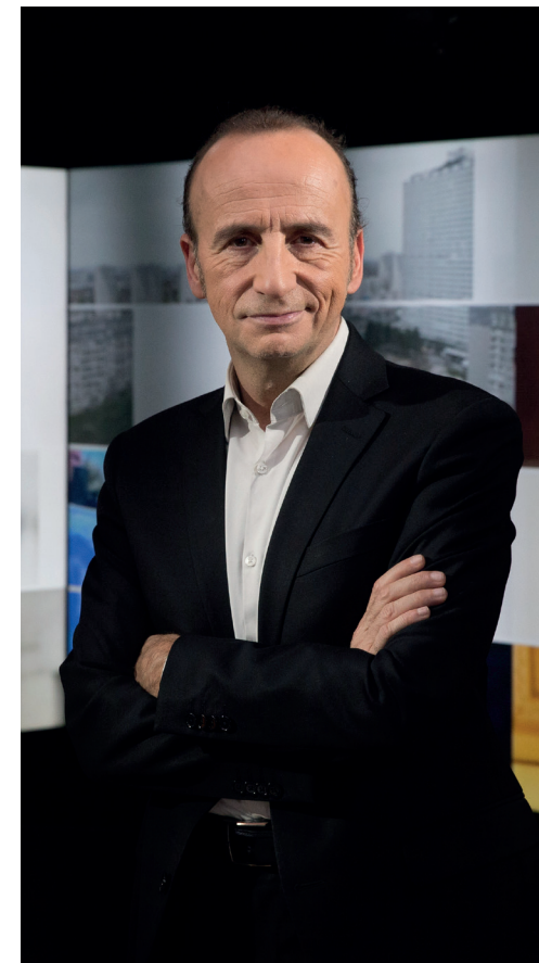
JEAN-PIERRE GRATIEN journaliste, présentateur de DÉBATDOC